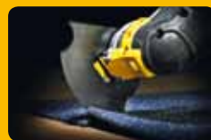
▲ Découpe de tissus lourds et revêtements de sol