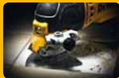
▲ Préparation des surfaces