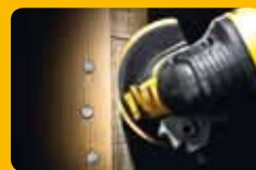
▲ Découpe de bois de construction