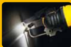
▲ Découpe des bordures et plaques de plâtre