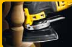
▲ Ponçage de détails