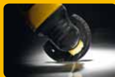
▲ Décollage d'enduit