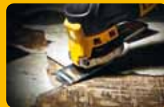
▲ Décollage d'adhésifs