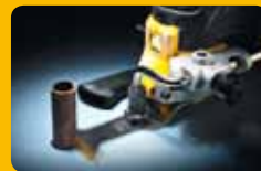
▲ Découpe de tubes