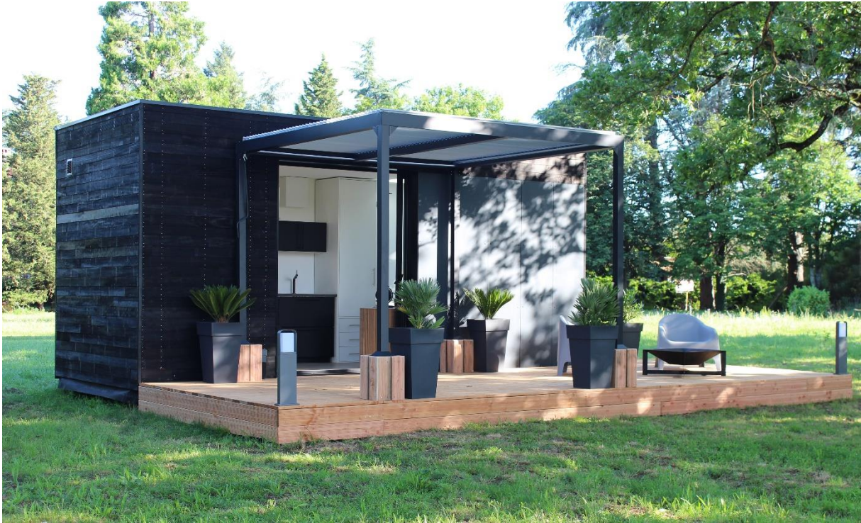
Projet Lodges in Move

Dans la lignée de la tendance actuelle du bois brûlé, Ducerf Groupe innove et lance son nouveau bardage « BARD 106 finition CARBON ». Durable et écologique grâce à son procédé de fabrication singulier, il combine une technique de traitement THT avec l'application d'une finition Noir Intense. Ce processus permet de faire ressortir le veinage et l'aspect brut de sciage du bois, révélant des reflets entre le noir profond et l'ébène selon l'orientation du soleil.