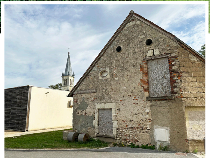
La longère rénovée de la chocolaterie Max Vauché

C'est dans cette optique que l'entreprise a choisi d'installer plusieurs unités de ventilation double-flux décentralisées PURECLASS de S&P France, une solution à la fois performante, esthétique et simple à mettre en œuvre.