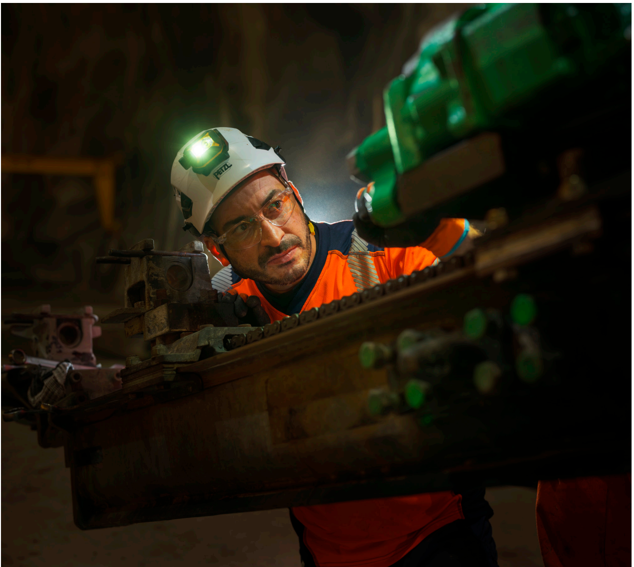
HD-PIXA R

Spécifiquement développée pour répondre aux exigences les plus strictes de l'industrie, elle bénéficie de la certification ATEX (II 1 G Ex ia IIC T4), ce qui permet d'évoluer en environnements explosibles. Dotée de la technologie CONSTANT LIGHTING, elle garantit une intensité lumineuse constante. Avec ses 350 lumens en mode BOOST et ses deux types de faisceaux (large, mixte), PIXA Z0 s'adapte à toutes les situations de travail.