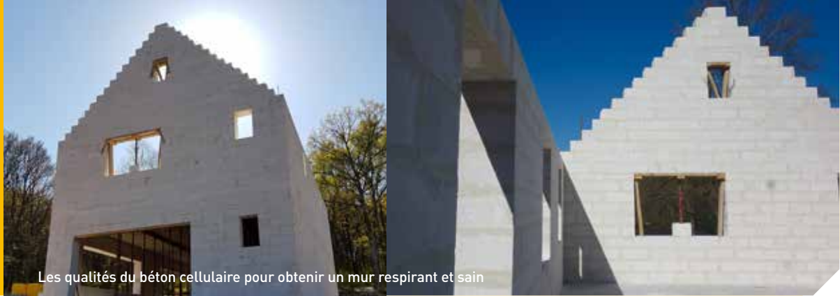
Les qualités du béton cellulaire pour obtenir un mur respirant et sain