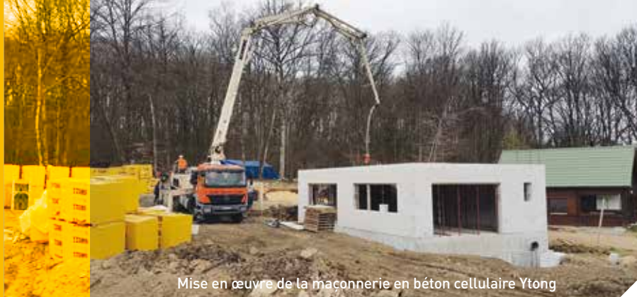
Mise en œuvre de la maçonnerie en béton cellulaire Ytong